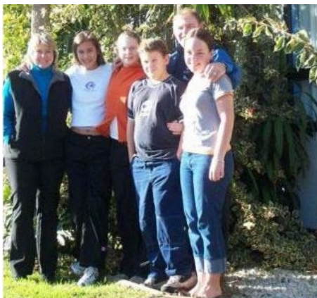
EINE NEUSEELÄDISCHE FAMILIE MIT GAST

Bei Buchung eines Kurses ab 12 Wochen ist der Transfer vom Flughafen Auckland zur Unterkunft in Whitianga kostenlos.