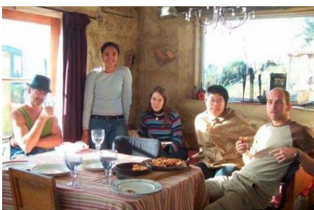
DIE NEUSEELÄNDER SIND UNKOMPIZIERT UND GASTFREUNDLICH