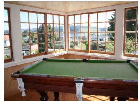
BILLARDZIMMER IN DER SCHULE