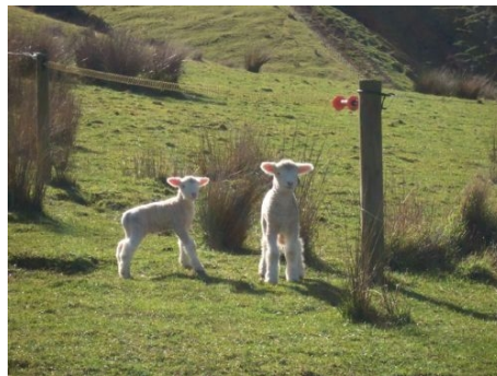
NEUGEBORENE LÄMMER AUF DER WEIDE

Sie wohnen in einem sorgfältig ausgewählten gastfreundlichen Privathaushalt und sind garantiert einziger Gast deutscher Muttersprache. Es wird voller Familienanschluss geboten. Unterkunft im Einzelzimmer mit Halbpension von Montag bis Freitag und voller Verpflegung am Wochenende. Für Teilnehmer, die gemeinsam reisen, auf Wunsch Doppelzimmer. Normalerweise werden für den Weg zur Schule 10 bis 15 Minuten zu Fuß oder mit dem Fahrrad benötigt, das die meisten Gastgeber zur Verfügung stellen.