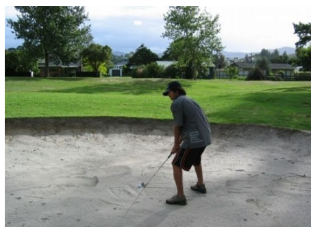
GOLFPLATZ MIT MEERBLICK!