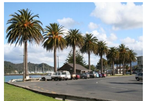
AM HAFEN VON WHITIANGA