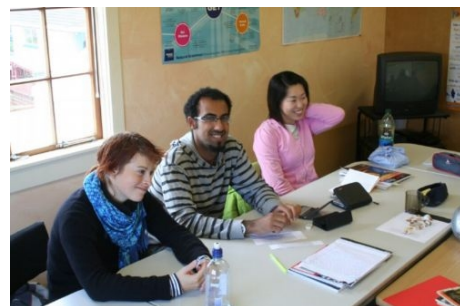
ENGLISCH LERNEN IN WHITIANGA AUF DER WUNDERSCHÖNEN COROMANDEL HALBINSEL

Im Preis enthalten: Einschreibgebühr der Schule, Einstufungstest, Unterricht, Lehrmaterial, Zertifikat, Betreuung durch die Schule, Reiseinformationen.