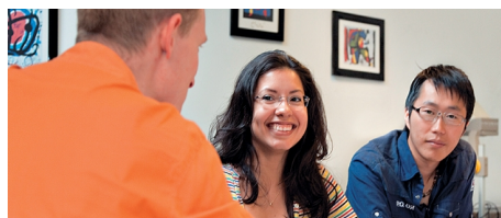
BUSINESS-ENGLISCH IN DER KLEINGRUPPE, ALS EINZEL-CRASH-KURS ODER KOMBINIERT

Im Preis enthalten: Einschreibgebühr der Schule, Einstufungstest, Unterricht, Lehrmaterial, Zertifikat, Betreuung durch die Schule, Reiseinformationen.