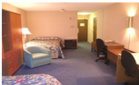
ZIMMER IN DER RESIDENZ CHESTNUT 89