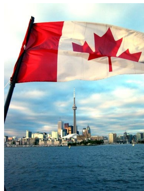
DIE SKYLINE VON TORONTO, VOM LAKE ONTARIO AUS GESEHEN