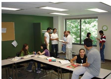
ANGEREGETE UNTERHALTUNG IN DER PAUSE