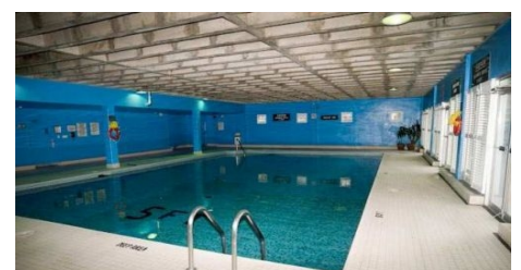
TOWN INN RESIDENZ: POOLANLAGE