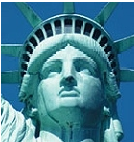
EIN MÖGLICHES HIGHT LIGHT: WOCHENEND- AUSFLUG NACH NEW YORK

FREIZEITMÖGLICHKEITEN Das ganze Jahr über organisiert die Schule ein vielseitiges Freizeitprogramm mit Besichtigungen, Spiel, Sport, Kino- und Theaterbesuchen, Tanzveranstaltungen, Wanderungen und Ausflügen. Dabei lernen Sie Studenten aus anderen Ländern kennen und werden viel Spaß haben. Mögliche Ausflugsziele sind die Niagarafälle, Québec City und Ottawa, gegebenenfalls New York City, Boston oder Chicago. Die Teilnahme an allen Aktivitäten ist freiwillig, anfallende Kosten bezahlen Sie vor Ort. Tagesausflüge kosten zwischen ca. CA$ 25 und ca. CA$ 100. Für Wochenendausflüge mit Übernachtung(en) müssen Sie mit CA$ 100 bis CA$ 350 rechnen.