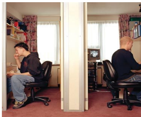
PRIMROSE RESIDENZ, ZIMMER