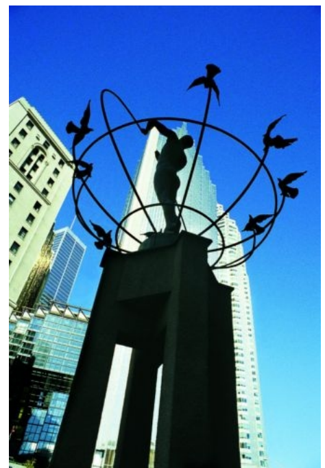
WELCOME TO TORONTO

Wenn Sie vom Flughafen abgeholt und zu Ihrer Unterkunft gebracht werden möchten, buchen Sie den von der Schule angebotenen Transfer. Er kostet pro Person für die einfache Strecke € 80.