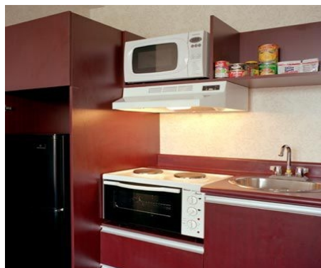
PRIMROSE RESIDENZ, KÜCHE