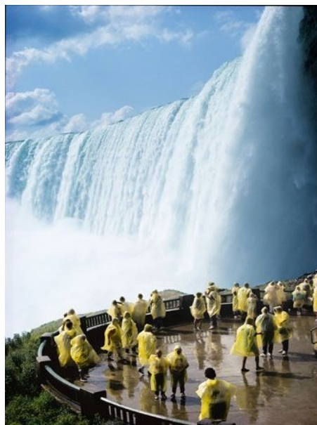
DIE NIAGARA-FÄLLE SIND EINE DER MEIST- BESUCHTEN SEHENSWÜRDIGKEITEN KANADAS UND DER USA – VON TORONTO SIND SIE ALS TAGESAUSFLUG ERREICHBAR

REISE Anreise: Samstag oder Sonntag Abreise: Samstag oder Sonntag