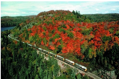
DER INDIAN SUMMER – EIN BESONDERES UND UNVERGESSLICHES ERLEBNIS