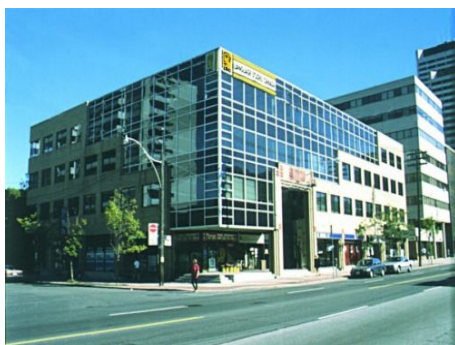
LSC LANGUAGE STUDIES CANADA, TORONTO

Internet-Zugang: kostenlos; Computer für den privaten Gebrauch in der Internet Lounge, drahtloser Zugang sowie Modem-Anschlüsse für Laptops