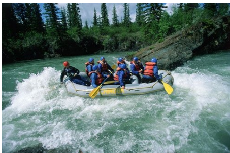
WILDWASSER-RAFTING UND BOOT FAHREN AUF DEM LAKE ONTARIO (OBEN MITTE)