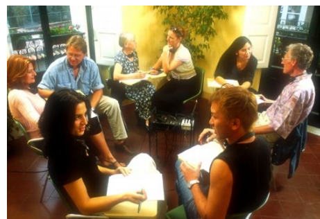
PRAKTISCHES KOMMUNIKATIONSTRAINING BEIM INTENSIVKURS IN TAORMINA

Im Preis enthalten: Einschreibgebühr der Schule, Einstufungstest, Unterricht, Lehrmaterial, Zertifikat, Betreuung durch die Schule, Reiseinformationen.