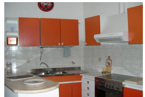
KÜCHE EINES STUDIOS