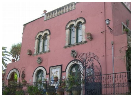
DIE VILLA NETTUNO MIT SCHÖNEM GARTEN