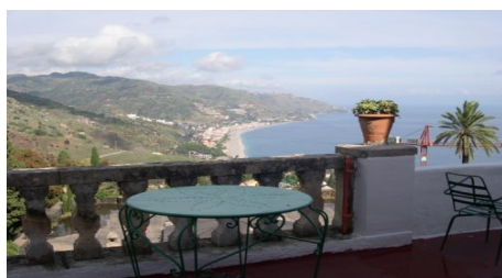
TERRASSE DER VILLA NETTUNO