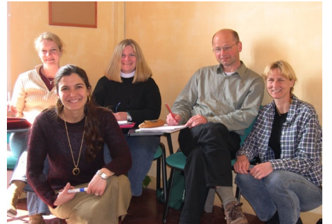
50+-GRUPPE MIT LEHRERIN

Im Preis enthalten: Einschreibgebühr der Schule, Einstufungstest, Unterricht, Lehrmaterial, Zertifikat, Betreuung durch die Schule, Kultur- und Ausflugsprogramm laut Beschreibung, Reiseinformationen.