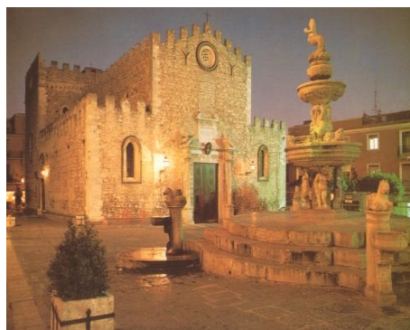
ABENDSTIMMUNG IN TAORMINA