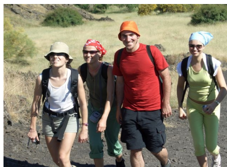
WANDERUNG IM GEBIET DES ÄTNA

Im Preis enthalten: siehe Einzelunterricht