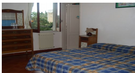
MÖBLIERTES ZIMMER IN TAORMINA