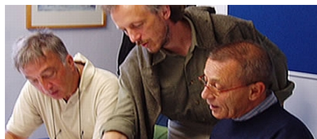
ENGLISCH LERNEN IN SIDMOUTH

Im Preis enthalten: Gruppentransfer von London Heathrow nach Sidmouth und zurück, Einschreibgebühr der Schule, Einstufungstest, Unterricht, Lehrmaterial, Zertifikat, Betreuung durch die Schule während des ganzen Aufenthaltes, Reiseinformationen.