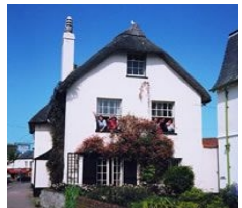
DAS MAY COTTAGE IN SIDMOUTH

Im Preis enthalten: siehe Intensivkurs 1