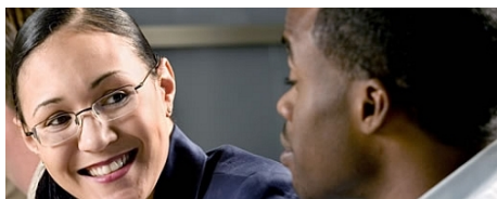
EINZEL-CRASH-KURS ENGLISCH IN SIDMOUTH

Im Preis enthalten: Gruppentransfer von London Heathrow nach Sidmouth und zurück, Einschreibgebühr der Schule, Einstufungstest, Unterricht, Lehrmaterial, Zertifikat, Betreuung durch die Schule während des ganzen Aufenthaltes, Reiseinformationen.