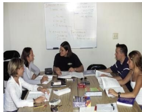
ENGLISCH LERNEN IN SAN DIEGO LA JOLLA

Im Preis enthalten: Einschreibgebühr der Schule, Einstufungstest, Unterricht, Lehrmaterial, Zertifikat, Willkommenstreff, Betreuung durch die Schule, Reiseinformationen.