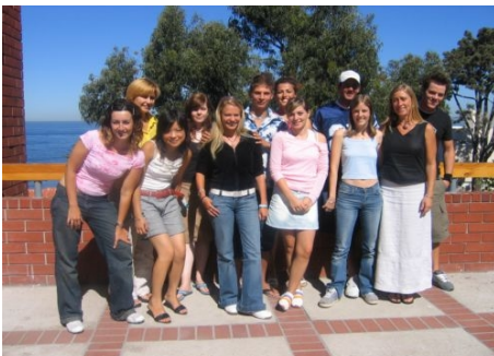
AUF DER TERRASSE DER SCHULE