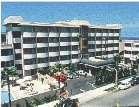
BEST WESTERN HOTEL INN BY THE SEA

Gutes Mittelklassehotel mit Swimmingpool und Restaurant, nur wenige Gehminuten von der Schule und dem Meer entfernt, 132 Zimmer mit Dusche, WC, TV, Telefon und Balkon. Weitere Informationen und Reservierung unter www.lajollainnbythesea.com