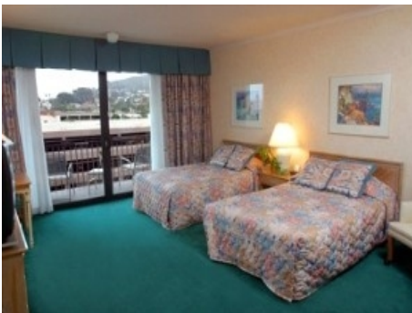
BEISPIEL EINES ZIMMERS