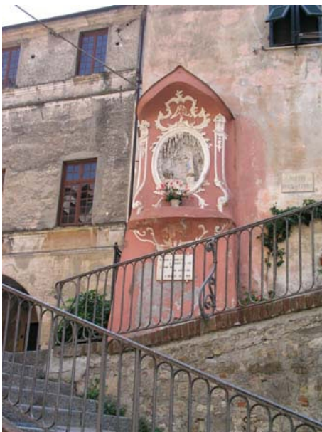
HÜBSCHER BRUNNEN IN SAN BARTOLOMEO

Sie können schwimmen, segeln, surfen, Tennis und Boccia spielen. Von der Schule organisiert werden ein Spaziergang zum alten Fischerort Cervo, ein Ausflug nach Imperia Porto Maurizio, der Besuch des Olivenmuseums, gemeinsames Kochen im Haus einer Lehrerin. Gegebenenfalls anfallende Kosten bezahlen Sie bei Teilnahme vor Ort.