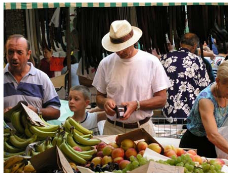
AUF DEM MARKT

Im Preis enthalten: Einstufungstest, Unterricht, Lehrmaterial, Zertifikat, Betreuung durch die Schule, Reiseinformationen.