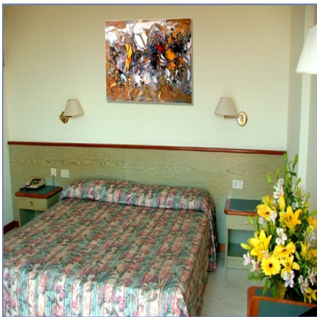
BEISPIEL EINES HOTELZIMMERS