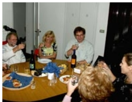
IN EINER WOHNGEMEINSCHAFT