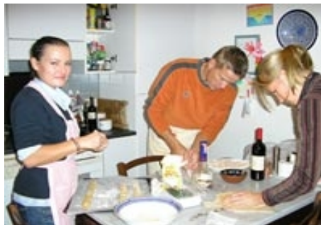
KOCHEN IM HAUS EINER LEHRERIN