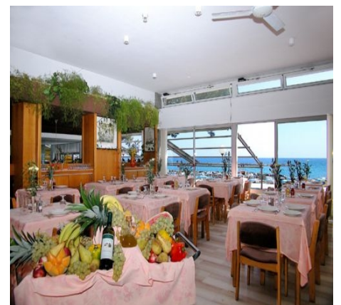
SPEISESAAL IN EINEM DER VERTRAGSHOTELS DER SCHULE IN SAN BARTOLOMEO AL MARE