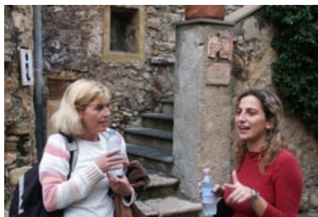
MIT EINER LEHRERIN UNTERWEGS