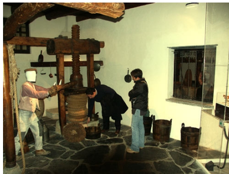
BESICHTIGUNG DES OLIVENMUSEUMS