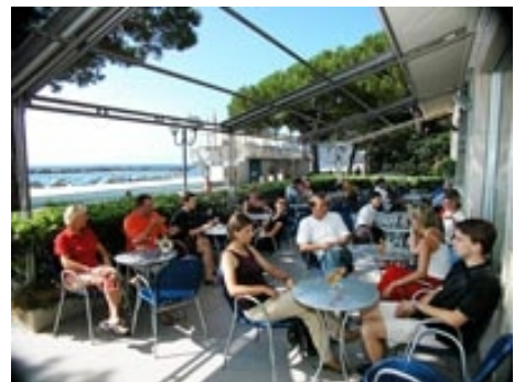
IM CAFE AM MEER

Im Preis enthalten: Einstufungstest, Unterricht, Lehrmaterial, Zertifikat, Betreuung durch die Schule, Reiseinformationen.