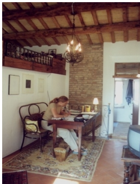
BEISPIEL EINES STUDIOS IN RAVENNA