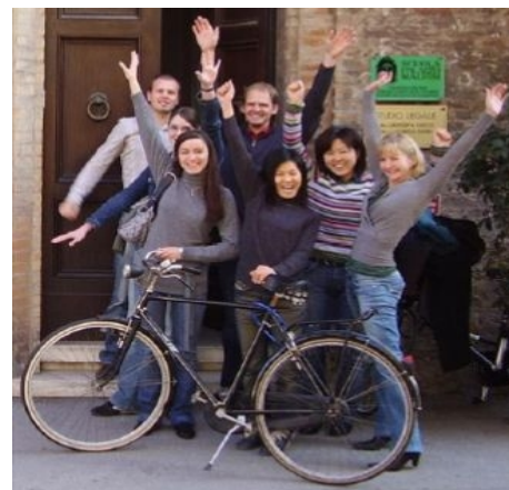
VOR DER SCHULE IN RAVENNA