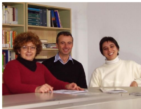
DUOKURS ITALIENISCH IN RAVENNA

Im Preis enthalten: siehe Einzel-Crash-Kurs