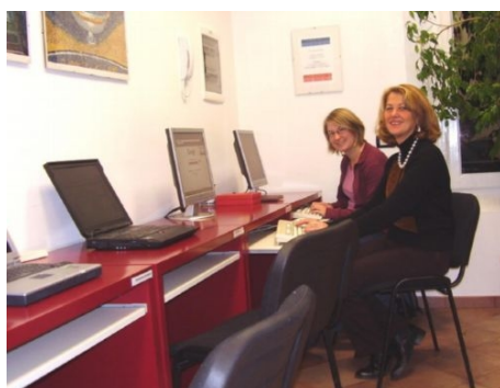
IM COMPUTERRAUM DER SCHULE

Internet-Zugang: kostenlos (6 PCs + WiFi)