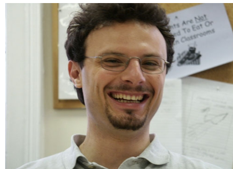
IN OXFORD ZU STUDIEREN, WAR SCHON IMMER ETWAS BESONDERES!

Im Preis enthalten: Einstufungstest, Unterricht, Lehrmaterial (Bücher leihweise), Zertifikat, Betreuung durch die Schule, Reiseinformationen.