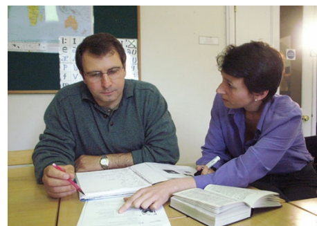
WOHNEN UND LERNEN IM HAUS EINER QUALIFIZIERTEN ENGLISCHLEHRERIN