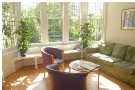
AUFENTHALTSRAUM IN DER SCHULE

Im Preis enthalten: Einstufungstest, Unterricht, Lehrmaterial (Bücher leihweise), Zertifikat, Betreuung durch die Schule, Reiseinformationen.