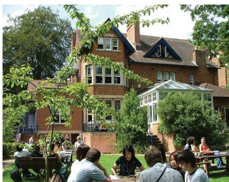
DIE SCHULE UND IHR GARTEN

Sonstiges: Die Schule ist auch sonntags nachmittags für die Studenten geöffnet, sie können Filme anschauen, die Computer benutzen, andere Studenten treffen.