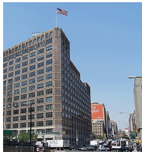
IN DIESEM GEBÄUDE HAT DIE LSI-SCHULE NEW YORK IHREN SITZ

Im Preis enthalten: siehe Executive Kleingruppe