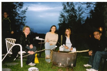
GRILLABEND MIT DEN GASTGEBERN