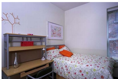
ZIMMER IN DER RESIDENZ „THE 515“