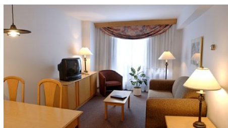
STUDIO 2250 GUY