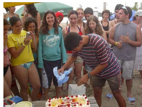
BON ANNIVERSAIRE IN CANADA!

Jeder Jugendliche wird, unabhängig von der Uhrzeit seiner Ankunft, vom Flughafen abgeholt und am Ende des Aufenthaltes wieder hingebacht. Beide Transfers sind im Kurspreis enthalten.