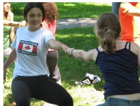
... UND BEI SPIELEN IM FREIEN