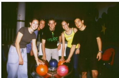
BOWLING – EINE VON VIELEN AKTIVITÄTEN

Die Residenz liegt ca. 25 Minuten von der Schule entfernt. Die Schüler fahren unter Aufsicht der Betreuer mit den öffentlichen Verkehrsmitteln zur Schule. Die Unterkunft beinhaltet volle Verpflegung mit Lunchpaketen an Kurs- und Ausflugs-tagen. Mindestens ein Betreuer wohnt in der Residenz. Duschen und WC stehen ausreichend zur Verfügung. Allein reisende Jugendliche können je nach Wunsch ein Einzelzimmer oder ein 2-Bettzimmer buchen.