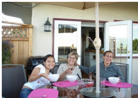
ALS GAST BEI EINER KANADISCHEN FAMILIE