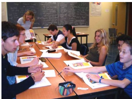
INTENSIV UND TROTZDEM LOCKER