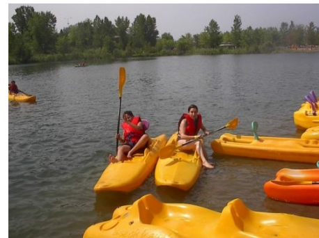
SEHR BELIEBT – PADDELN

Im Preis enthalten: Transfer vom Flughafen zur Unterkunft und zurück, Einschreibgebühr der Schule, Einstufungstest, Unterricht, Lehrmaterial, Zertifikat, Unterkunft mit voller Verpflegung, Pass für die öffentlichen Verkehrsmittel, Betreuung durch die Schule während des ganzen Aufenthaltes, Aktivitätenprogramm und Ausflüge laut Beschreibung, Krankenversicherung, Reiseinformationen.