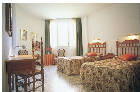
CLUB HISPANICO, DOPPELZIMMER