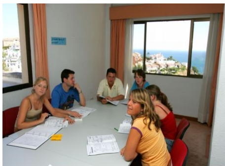
DIE LEHRER WECHSELNS STÜNDLICH

Im Preis enthalten: siehe Intensivkurs 1