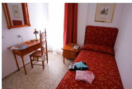
CLUB HISPANICO - EINZELZIMMER