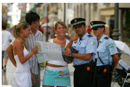
JUGENDLICHE UNTERWEGS IN MÁLAGA

Im Preis enthalten: Einschreibegebühr der Schule, Einstufungstest, Unterricht, Lehrmaterial, Zertifikat, Betreuung durch die Schule, Reiseinformationen, Freizeitprogramm und ein Tagesausflug pro 2-Wochen-Kurs.