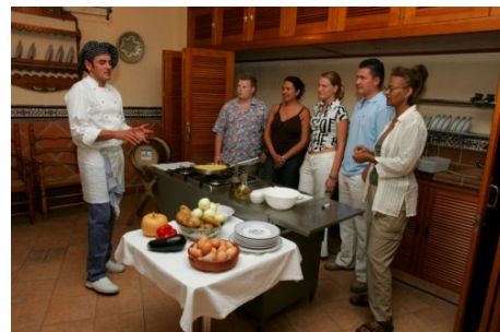
SPASS BEIM KOCHKURS IN MALAGA

Im Preis enthalten: wie beim Intensivkurs 1 plus Kochkurs wie beschrieben und Rezeptbuch.