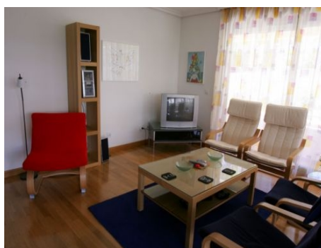
BEISPIEL EINES APARTMENTS TYP A