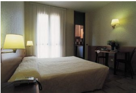
STUDIO BIANCACROCE IN MAILAND

Die Residenz bietet 60 Studios zur Alleinbenutzung oder für 2 Personen, die gemeinsam reisen. Wohn-/ Schlafzimmer, Küche, Bad/Dusche, WC, Satelliten-TV, Klimaanlage. Für den Weg zur Schule werden ca. 10 Minuten mit dem Bus oder Strassenbahn benötigt. Weitere Informationen und Reservierung unter www.residencebiancacroce.it