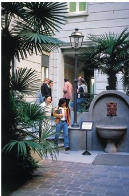
DER EINGANG DER SPRACHSCHULE LINGUA-DUE IN MAILAND