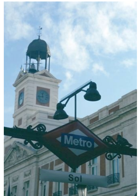
DIE METRO VON MADRID