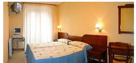
ZIMMER IM HOSTAL BENAMAR