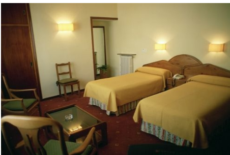
ZIMMER IN EINER PRIVATUNTERKUNFT

MÖBLIERTES ZIMMER Je nach Verfügbarkeit in einer Wohngemeinschaft, in einem Privathaushalt oder als separates Zimmer; Doppelzimmer nur für gemeinsam Reisende. Küchen- und Badbenutzung ist immer möglich, Bettwäsche vorhanden. Handtücher bringen Sie bitte mit. Für den Weg zur Schule werden normalerweise 10 bis 40 Minuten zu Fuß oder mit öffentlichen Verkehrsmitteln benötigt. Die Zimmer können für maximal 4 Wochen im Voraus gebucht werden. Eine Verlängerung vor Ort ist jederzeit möglich. Kosten für die Verlängerung pro Woche € 90 für ein Doppelzimmer und € 150 für ein Einzelzimmer.