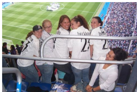
IM STADION VON REAL MADRID

Eine Zehnerkarte für Busse und Metro kostet ca. € 8, ein Monatspass ca. € 40.