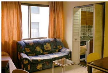
APARTMENT RECOLETOS, IN UNMITTLBARER NÄHE DER SCHULE UND DES PRADO

HOSTAL BENAMAR Einfaches, sauberes Hostel in einem der alten Stadtviertel mit vielen Bars, Restaurants und Geschäften. Die Zimmer haben Dusche, WC, Klimaanlage, TV, Safe und Internetanschluss. Doppelzimmer können nur von gemeinsam Reisenden gebucht werden. Die Schule ist zu Fuß in ca. 20 Minuten erreichbar. Selbstverpflegung.