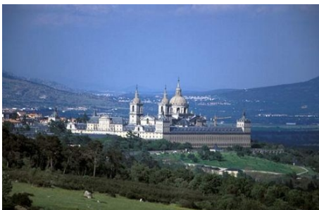
DER ESCORIAL IN DER NÄHE VON MADRID

Im Preis enthalten: Einschreibgebühr der Schule, Einstufungstest, Unterricht, Lehrmaterial (Bücher leihweise), Zertifikat, Betreuung durch die Schule, Reiseinformationen, bei Buchung des 12-Wochen-Kurses auch der Transfer vom Flughafen zur Unterkunft. Nicht im Preis enthalten: Die DELE-Prüfungsgebühr von ca. € 130 bis € 170 ist vor Ort zu bezahlen.