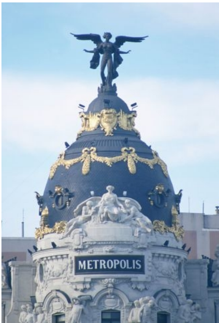
METROPOLIS IN DER GRAN VIA