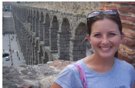
AUSFLUG NACH SEGOVIA