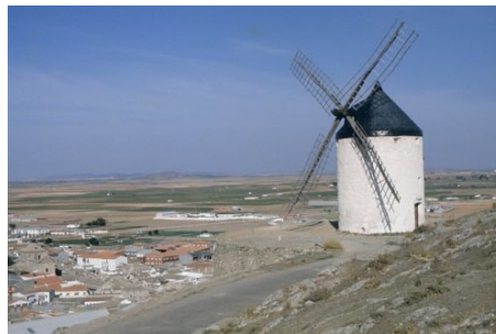
AUSFLUG IN DIE MANCHA