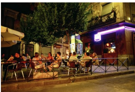
IN EINEM DER STRASSENCAFES IN MADRID