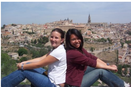
AUSFLUG NACH TOLEDO