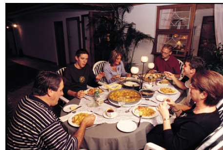
ALS GAST IN EINEM PRIVATHAUSHALT