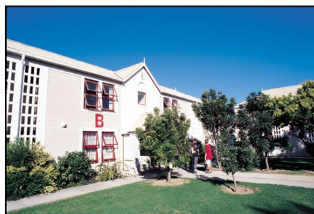
DIE YMCA RESIDENZ IN OBSERVATORY