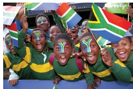
WELCOME TO SOUTH AFRICA!

Busse und Metrorail sind schnell, sicher und preisgünstig. Trotzdem sollten Sie, wenn Sie nach Einbruch der Dunkelheit allein unterwegs sind, nach Möglichkeit ein Taxi benutzen. Eine Wochenkarte für die Metro kostet ca. € 6.