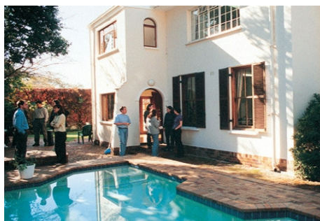
DAS STUDENTENHAUS IN RONDEBOSCH