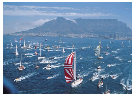
SEGELREGATTA IN KAPSTADT

Die Schule organisiert Stadtrundgänge, Theater-, Kino- und Pubbesuche, Wanderungen, Radtouren, Ausflüge zum Kap, nach Stellenbosch, Franschhoek und an die Westküste. Mit Hilfe des Freizeitkoordinators können Sie aus einer Fülle von Sportarten wählen, ein Auto mieten oder eine Anschluss-tour buchen, z.B. in den Krüger-Nationalpark, zu den Victoria-Fällen oder ins Okavango-Delta. Die Teilnahme am Freizeitprogramm ist freiwillig. Anfallende Kosten bezahlen Sie vor Ort