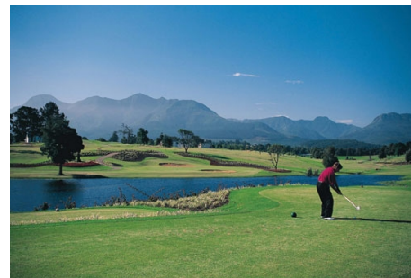
IN DER KAPREGION GIBT ES HERRLICHE GOLFPLÄTZE