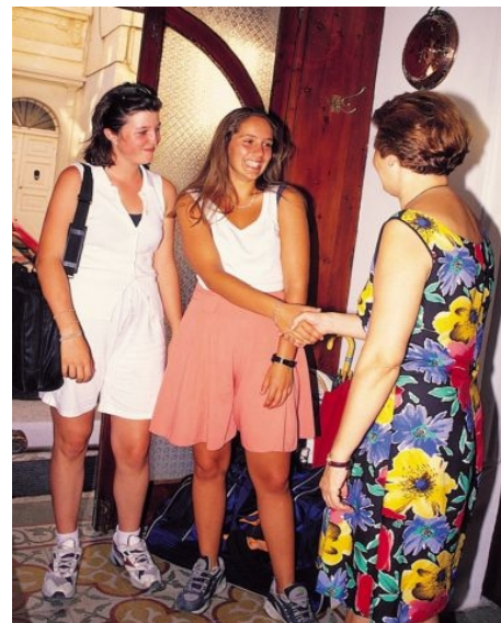
WILLKOMMEN BEI MALTESISCHEN GASTGEBERN

Im Preis enthalten: Einstufungstest, Unterricht, Lehrmaterial, Zertifikat, Betreuung durch die Schule, Freizeit- und Ausflugsprogramm laut Beschreibung, Reiseinformationen.