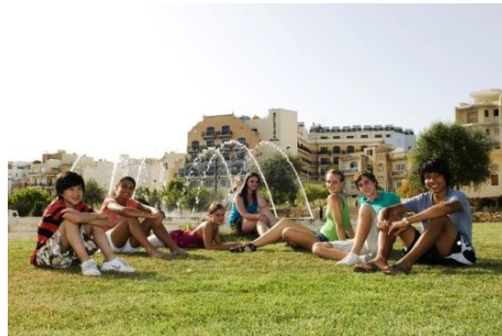
KOMPLEX DER BELLA VISTA RESIDENZ MIT SWIMMINGPOOL UND GRÜNFLÄCHEN

Der Transfer vom Flughafen Malta zur Unterkunft und zurück ist im Preis enthalten.