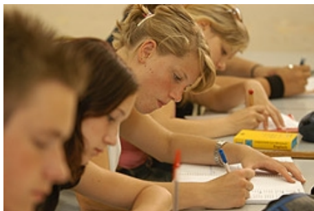
ENGLISCH LERNEN IN MALTA

Internet-Zugang: kostenlos im Self Access Learning Centre