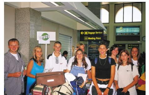
EMPFANG AM FLUGHAFEN MALTA

Bei Buchung des Kurses mit Unterkunft ist der Transfer vom Flughafen Malta zur Unterkunft und zurück im Preis enthalten – unabhängig von der Ankunfts- und Rückreisezeit.