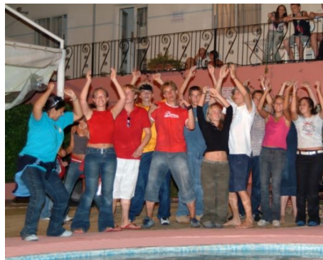
TOLLE STIMMUNG BEI DER PARTY