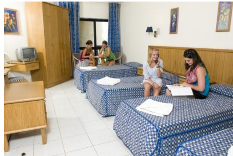
BEISPIEL EINES 4-BETTZIMMERS IN DER BELLA VISTA RESIDENZ