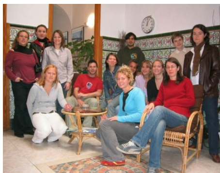
GRUPPENBILD IM PATIO DER SCHULE

Die Schule informiert laufend über Sportmöglichkeiten und Veranstaltungen jeder Art und organisiert Aktivitäten und Ausflüge, die Sie bei Teilnahme direkt bezahlen. Außerdem ist sie bei allen Fragen der individuellen Freizeitgestaltung behilflich.