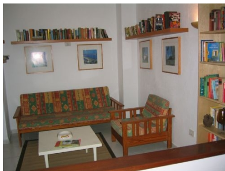
ZIMMERBEISPIELE IN DER SCHULRESIDENZ