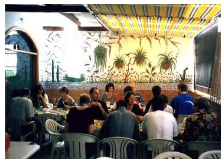
IN DER CAFETERIA DER SCHULE

Im Preis enthalten: siehe Einzelunterricht