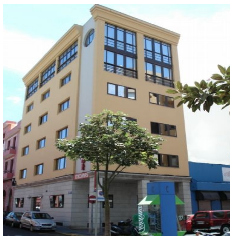
DIE BEST-RESIDENZ IN LAS PALMAS