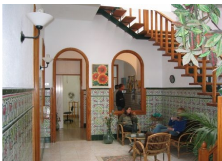
DER PATIO DER SCHULE

→ STANDARDKURS Lektionen pro Woche/ Niveaustufen: 20 à 50 Minuten für Stufen A0 – B2 15 à 50 Minuten für Stufe C1