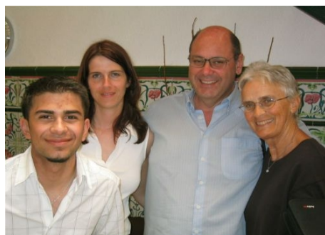
KURSTEILNEHMER WÄHREND DER PAUSE

Im Preis enthalten: Einstufungstest, Unterricht, Betreuung durch die Schule, Reiseinformationen. Nicht im Preis enthalten: Das Lehrmaterial für ca. € 25 ist vor Ort zu bezahlen. Ein Teilnahmezertifikat wird auf Wunsch vor Ort zum Preis von € 5 ausgestellt.