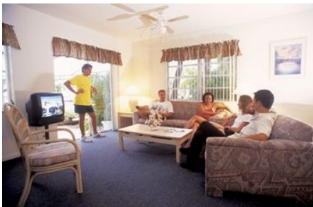
STUDIO IN DER GREEN ISLAND INN RESIDENZ