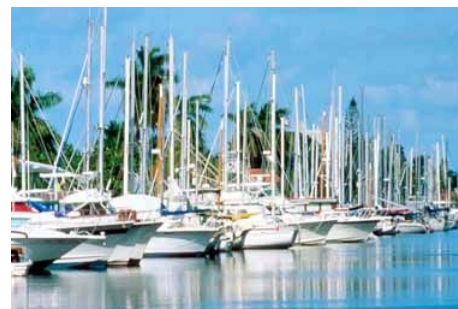
DER FREIZEITHAFEN VON FORT LAUDERDALE