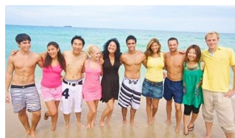
AM STRAND VON FORT LAUDERDALE