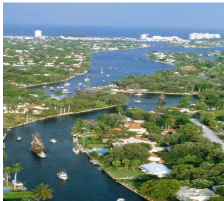
TYPISCH FÜR FORT LAUDERDALE: DIE WASSERSTRASSEN UND KANÄLE

Ein Buspass für 1 Woche kostet ca. US$ 16, ein 4 Wochenpass ca. US$ 45.