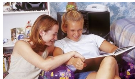
IN EINER PRIVATUNTERKUNFT

BED AND BREAKFAST Sie haben ein Einzelzimmer mit Frühstück in einem ausgewählten Privathaushalt. Doppelzimmer können nur von gemeinsam Reisenden gebucht werden. Für den Weg zur Schule benötigen Sie mit öffentlichen Verkehrsmitteln nicht mehr als 45 Minuten.