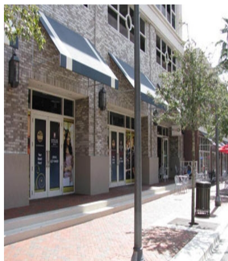
EMBASSY CES IN FORT LAUDERDALE

Im Preis enthalten: siehe Intensivkurs 1