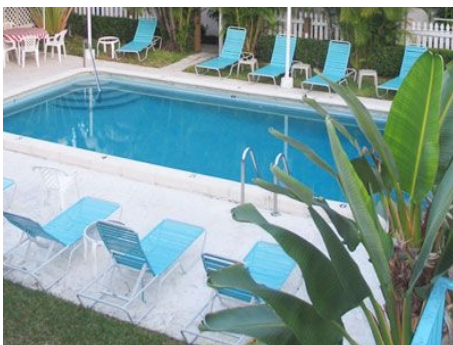
POOL DER GREEN ISLAND INN RESIDENZ