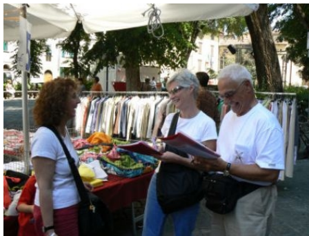
AUF DEM MARKT

Außerdem unternehmen Sie einen ausführlichen Stadtrundgang, besichtigen das Dommuseum, die Brancacci-Kapelle und die berühmten Fresken von Masaccio und Masolino.