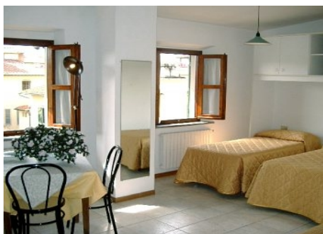
WOHN-/SCHLAFRAUM EINES STUDIOS IM PALAZZO MANNAIONI IN FLORENZ