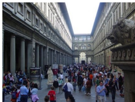
DIE WELTBERÜHMTE UFFIZIEN IN FLORENZ KANN MAN NICHT OFT GENUG BESUCHEN!

Ein Busticket kostet ca. € 1,20, eine Monatskarte ca. € 34.