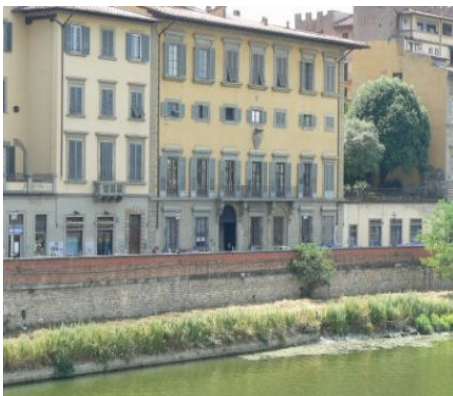
DIE SCHULE FIORENZA IN FLORENZ

Sterne FÜR TEILNEHMER AB 50 JAHRE Lektionen pro Woche: 15 à 50 Minuten Gruppenstärke: 4 bis 12 Personen