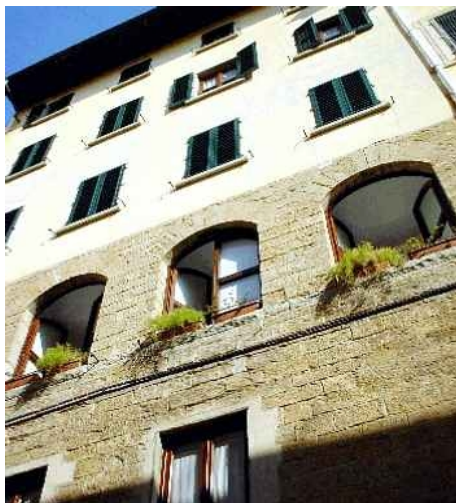
DER PALAZZO MANNAIONI IN FLORENZ