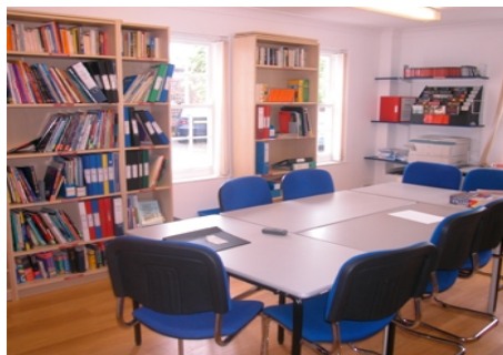
UNTERRICHTSRAUM FÜR ERWACHSENE

Im Preis enthalten: Einschreibgebühr der Schu- le, Einstufungstest, Unterricht, Lehrmaterial (Bü- cher leihweise), Zertifikat, Betreuung durch die Schule während des ganzen Aufenthaltes, Reisein- formationen.