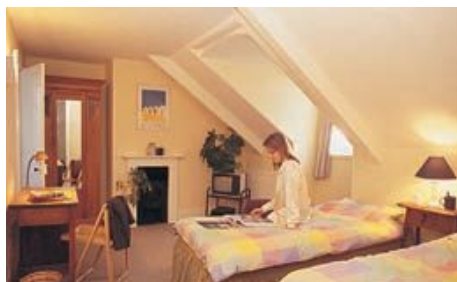
ZIMMER IN EINER PRIVAUNTERKUNFT