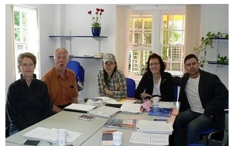
ENGLISCH FÜR ERWACHSENE IN EXETER