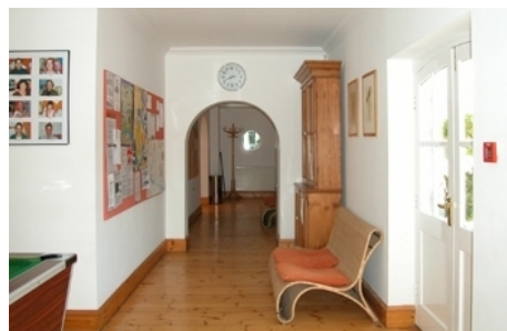
GLOBE ENGLISH CENTRE FÜR ERWACHSENE

Im Preis enthalten: Einschreibgebühr der Schule, Einstufungstest, Unterricht, Lehrmaterial (Bücher leihweise), Zertifikat, Betreuung durch die Schule, Reiseinformationen.