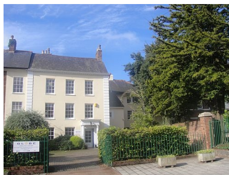
EINGANG ZUR „RECEPTION“ DES GLOBE ENGLISH CENTRE IN EXETER

Jeder Kurs beginnt mit einem Einstufungstest, am Ende des Kurses erhalten alle Teilnehmer ein Zertifikat.