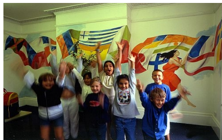
FRÖHLICHE KINDER IN EXETER

→ SOMMERKURS „EXPLORER“ FÜR BEGLEITETE KINDER 7 bis 10 Jahre