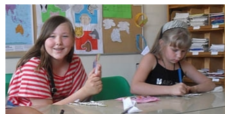
ENGLISCH LERNEN MACHT SPASS

Im Preis enthalten: Einschreibgebühr der Schule, Einstufungstest, Unterricht, Lehrmaterial (Bücher leihweise), Zertifikat, Freizeitprogramm, Betreuung durch die Schule während des ganzen Aufenthaltes, Reiseinformationen.