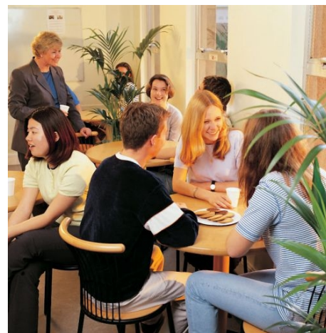
AUFENTHALTSRAUM DER HORNER SCHOOL

Im Preis enthalten: siehe Einzel-Crash-Kurs