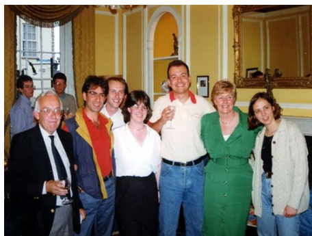
LEITUNG UND MITARBEITERTEAM DER HORNER SCHOOL OF ENGLISH

Im Preis enthalten: s. Kombinationskurs 3 und 4