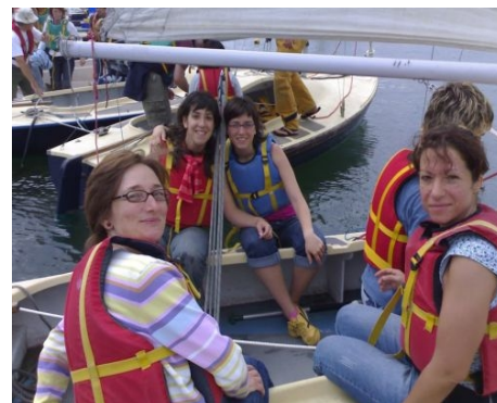
AUSFLUG MIT DEM BOOT

Im Preis enthalten: Einschreibgebühr der Schule, Einstufungstest, Unterricht, Zertifikat, Betreuung durch die Schule, Reiseinformationen.