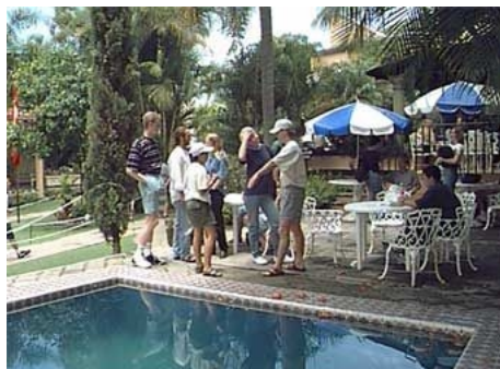
IM GARTEN DER SCHULE

Im Preis enthalten: Einschreibgebühr der Schule, Einstufungstest, Unterricht, Zertifikat, Betreuung durch die Schule, Reiseinformationen. Nicht im Preis enthalten: Das Lehrmaterial für ca. $ 30 bis $ 50 ist vor Ort zu bezahlen.