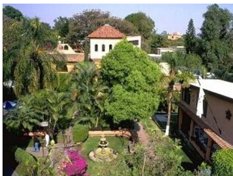
DER HAUPTCAMPUS DER SCHULE

Internet-Zugang: kostenlos, Anschlüsse für Laptops sind ebenfalls vorhanden.