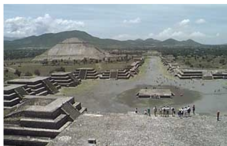
DIE MONDPYRAMIDE VON TEOTIHUACAN