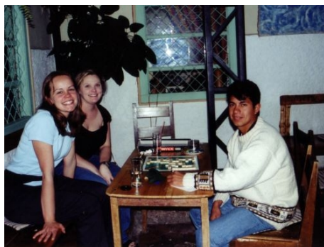
PRIVATUNTERKUNFT IN CUENCA