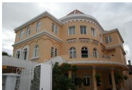
DAS ****HOTEL LA CASONA IN CUENCA