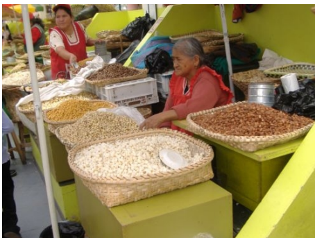
AUF DEM MARKT VON CUENCA