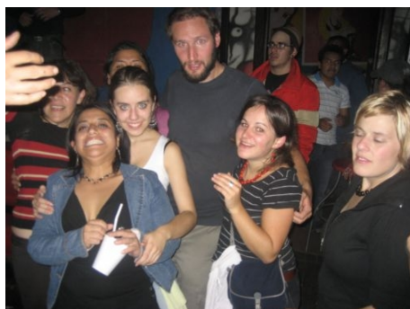
GUTE STIMMUNG AUF DER PARTY