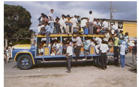
ABENTEUERLICHE FAHRT MIT EINEM DER ÖFFENTLICHEN BUSSE

kerdörfer. Die Teilnahme an allen Aktivitäten ist freiwillig; anfallende Kosten bezahlen Sie vor Ort