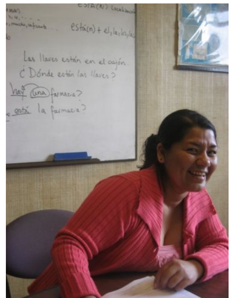
LEHRERIN IN CUENCA