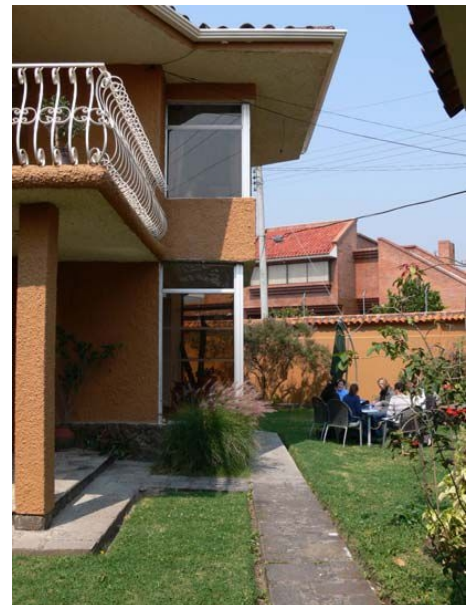
GEBÄUDE DES ESTUDIO INTERNACIONAL SAMPERE IN CUENCA