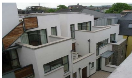
DIE COPLEY COURT RESIDENZ