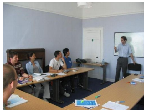
INTENSIVKURS ENGLISCH IN CORK