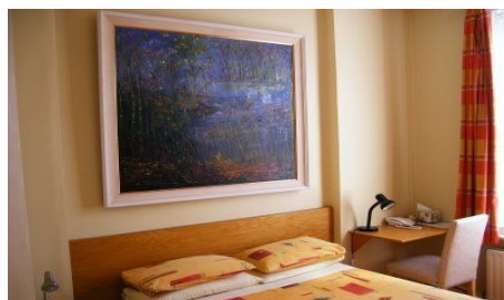
ZIMMER IN DER PENSION ROSE LODGE

Weitere Informationen und Buchung unter www.roselodge.net