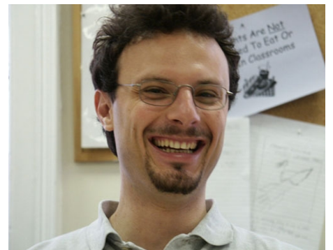
EINZEL-CRASH-KURS ENGLISCH IN CORK