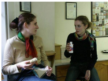
ENGLISCH – AUCH WÄHREND DER PAUSE

Im Preis enthalten: Einstufungstest, Unterricht, Lehrmaterial, Zertifikat, Betreuung durch die Schule, Reiseinformationen.