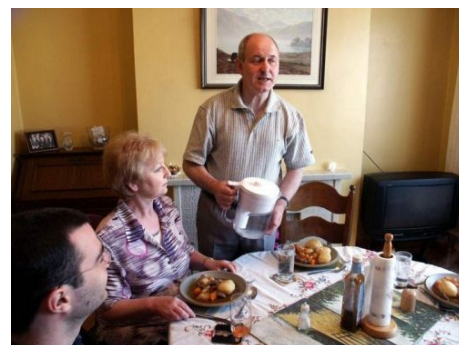
DIE GASTFREUNDLICHKEIT DER IREN IST SPRICHWÖRTLICH