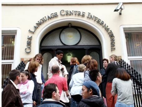
DAS CORK LANGUAGE CENTRE