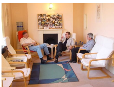
STUDENTEN IN DER LOUNGE DER SCHULE ...