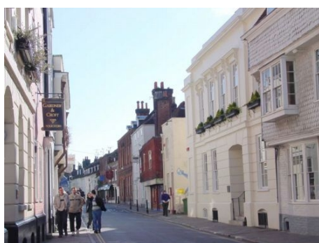
CANTERBURY LANGUAGE TRAINING CENTRE