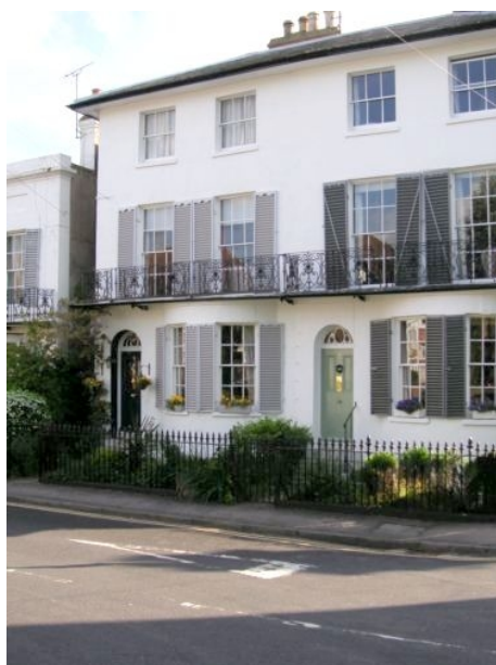
HAUS EINER PRIVATUNTERKUNFT