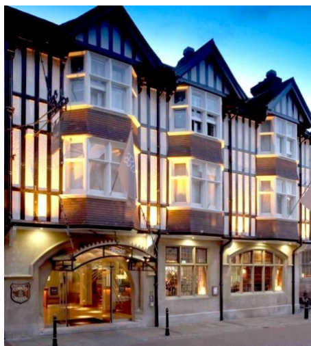
DAS ****ABODE HOTEL IN CANTERBURY

Weitere Hotel-Informationen unter www.abodehotels.co.uk/canterbury/