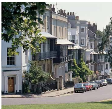
FÜR BRISTOL TYPISCHE WOHNGEGEND

Im Preis enthalten: Einstufungstest, Unterricht, Lehrmaterial (Bücher leihweise), Zertifikat, Betreuung durch die Schule, Reiseinformationen.