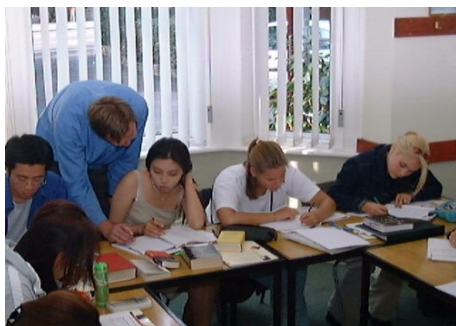
INTENSIVKURS FÜR 16- BIS 20-JÄHRIGE