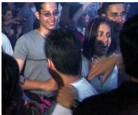
SPASS IN DER FREIZEIT „MUSS“ SEIN!

Unterkunft: Jeder Jugendliche wohnt als einziger Gast seiner Muttersprache in einem sorgfältig ausgewählten Privathaushalt, je nach Buchung im Einzel- oder 2-Bettzimmer. Es wohnen nie mehr als 4 Jugendliche bei einer Familie. Geschwister, Freunde oder Freundinnen können auf Wunsch bei derselben Familie wohnen. Die Unterkunft beinhaltet Halbpension, am Wochenende Vollpension.