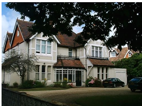
HAUS EINER GASTFAMILIE