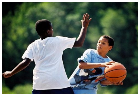
BALLSPIELE IM PARK