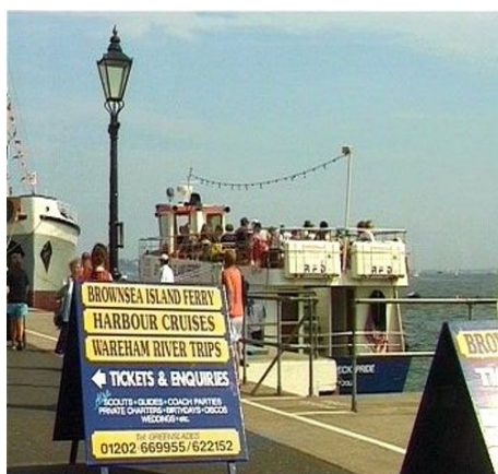
ANLEGESTELLE FÜR BOOTS-AUSFLÜGE

Transfer: Bei Ankunft in London Heathrow am Samstag zwischen 11.00 und 17.00 Uhr und Rückflug am Samstag zwischen 12.00 und 18.00 Uhr kann der von der Schule organisierte Gruppentransfer in Anspruch genommen werden. Er ist im Preis enthalten. Bei abweichender Ankunfts- oder Rückreisezeit kann ein individueller Transfer arrangiert werden. Er kostet für die einfache Strecke € 159.