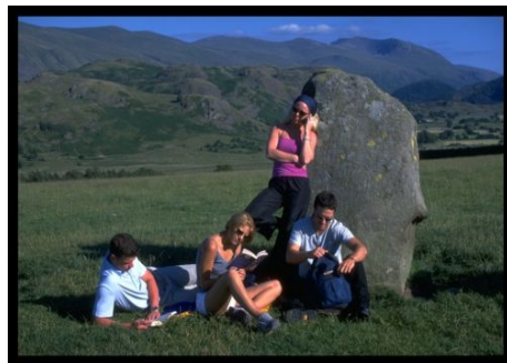
AUSFLUG MIT DER SCHULE