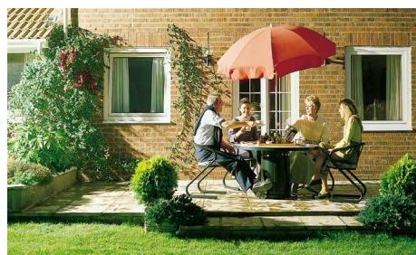
WOHNEN BEI FREUNDLICHEN GASTGEBERN