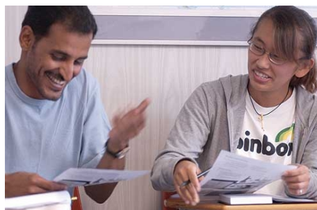
KLEINE GRUPPE – GROSSER LERNERFOLG

Im Preis enthalten: siehe Executive Kleingruppe