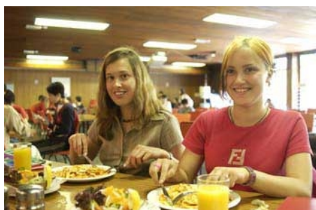
MITTAGESSEN IM RESTAURANT DER SCHULE

Ein Buspass für 2 Wochen kostet ca. £ 30, ein Pass für 3 Wochen ca. £ 45.