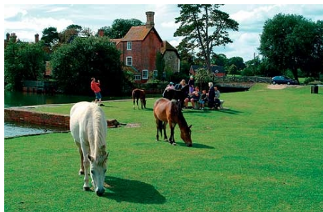
IM NEW FOREST NATIONAL PARK

Das Ausflugs- und Freizeitprogramm umfasst pro Woche einen Ganz- und einen Halbtagsausflug sowie zwei kulturelle Aktivitäten am Nachmittag oder Abend, z.B. eine Sightseeing-Tour, den Unterricht vertiefende Rollenspiele und Filme, eine Küstenwanderung auf dem „Poole Cockle Trail“ ein Quiz-Abend und/oder eine Abschiedsparty. Ausflugsziele sind London mit Besichtigung des Buckingham Palace und der National Gallery, Salisbury und seine berühmte Kathedrale, Lynton und der New Forest National Park, Stonehenge, Lyme Regis mit einer Bootsfahrt entlang der zum World Heritage gehörenden Jurassic Coastline sowie Kingston Lacy mit dem aus dem 17. Jahrhundert stammenden Herrenhaus und seinen Gärten. Daneben bleibt noch genügend freie Zeit für den einen Museumsbesuch, einen gemütlichen Einkaufsummel oder einen Nachmittagsteet mit Blick aufs Meer.