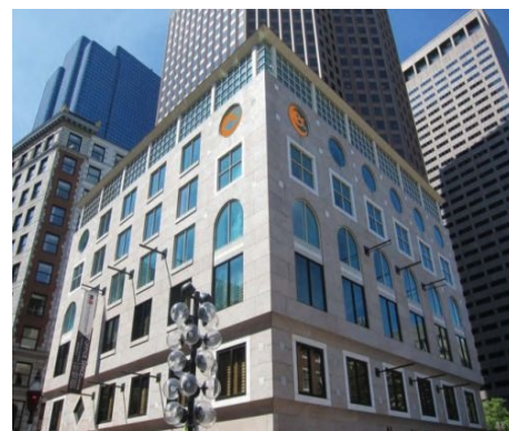
DIE EC-SCHULE IN BOSTON