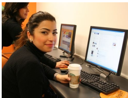
ARBEIT MIT COMPUTERPROGRAMMEN

Im Preis enthalten: s. TOEFL-Vorbereitungskurs Nicht im Preis enthalten: Die Prüfungsgebühr für die Test ist vor Ort zu bezahlen.