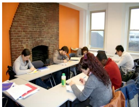
UNTERRICHT IN KOMFORTABLEN RÄUMEN