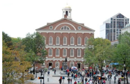
DER FANEUIL HALL SQUARE