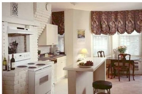
KÜCHE IN DER SUPERIOR RESIDENZ