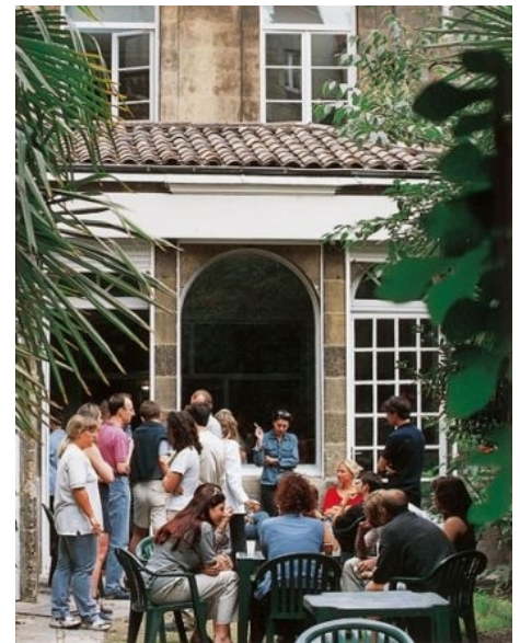
UNTERRICHTSPAUSE IM GARTEN DER SCHULE