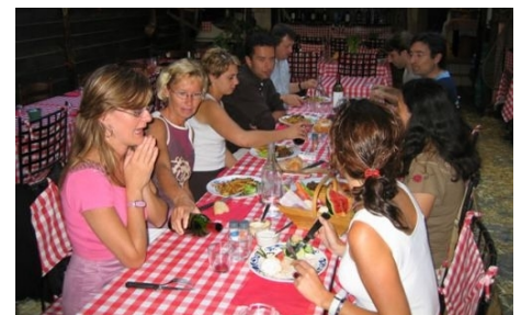
STUDENTEN IM RESTAURANT