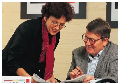
EINZELUNTERRICHT IN BORDEAUX

SAINT-EMILION, BERÜHMT DURCH SEINE WEINE UND WELTKULTURERBE DER UNESCO