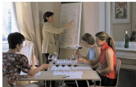
FRANZÖSISCH UND WEINKUNDE

Im Preis enthalten: Einschreibgebühr der Schule, Einstufungstest, Unterricht, Lehrbücher leihweise, Zertifikat, 15 Stunden Weinkunde, 2 Ausflüge, Betreuung durch die Schule, Reiseinformationen.