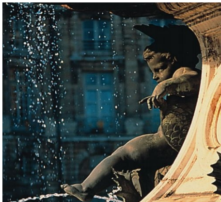
EINER DER VIELEN BRUNNEN VON BORDEAUX