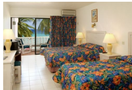
ZIMMER IM SOUTHERN PALMS BEACH CLUB