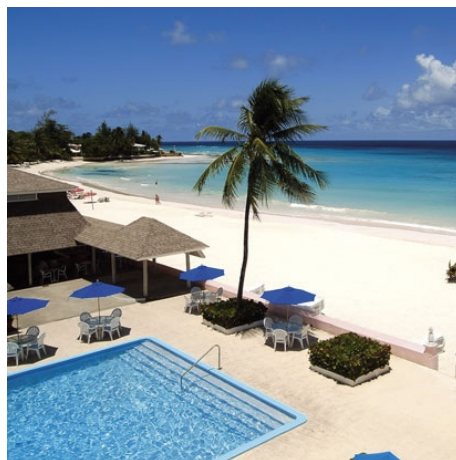
DER SOUTHERN PALMS BEACH CLUB

Weitere Informationen über den Southern Beach Club unter www.southernpalms.net