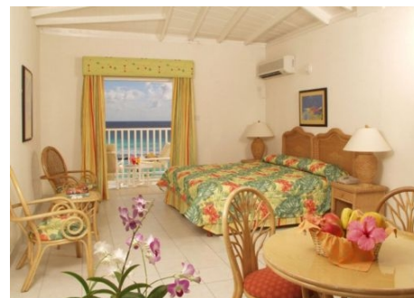
ZIMMER IM AMARYLLIS BEACH RESORT

Zusätzliche Ausflüge können Sie bei der Hotelrezeption buchen oder in Eigeninitiative unternehmen. Öffentliche Busse verbinden alle Orte der Insel und verkehren von 6.00 Uhr bis Mitternacht. Mit einem internationalen Führerschein können Sie auch ein Auto mieten und damit die Insel erkunden. Das Straßennetz ist gut ausgebaut, es herrscht Linksverkehr.