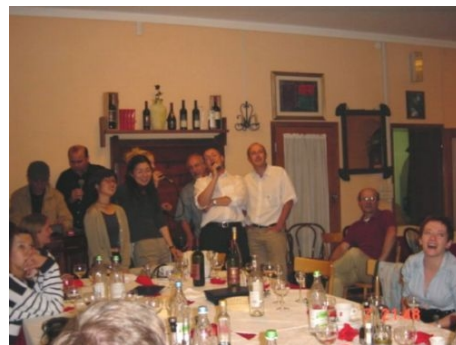
GELEGENTLICH WIRD GEMEINSAM GEKOCHT UND GEGESSEN