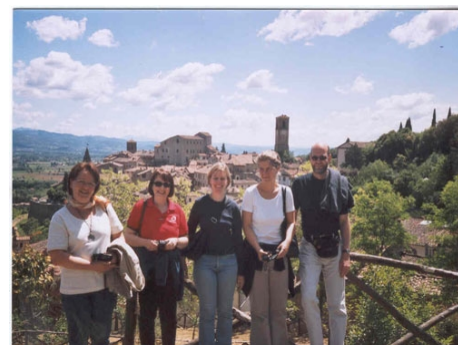
AUSFLUG MIT DER SCHULE