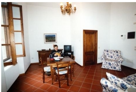
BEISPIEL EINES STUDIOS IN BAGNO

FREIZEITMÖGLICHKEITEN Ganz nach Lust und Laune genießen Sie die Kur- und Wellness-Angebote der örtlichen Thermalbäder, die frische Luft und die Natur. Sie können Tennis oder Boccia spielen, schwimmen, angeln, reiten oder Touren mit dem Mountainbike oder Ausflüge zu den Tiberquellen, dem Passo dei Mandrioli, dem Monte Fumaiolo und natürlich ins weltberühmte Chianti-Gebiet unternehmen. Die Teilnahme an den von der Schule organisierten Aktivitäten ist freiwillig; soweit Kosten anfallen, bezahlen Sie diese vor Ort