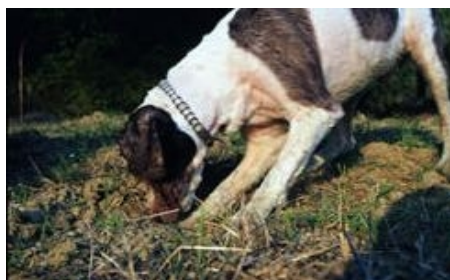
DEN TRÜFFELN AUF DER SPUR