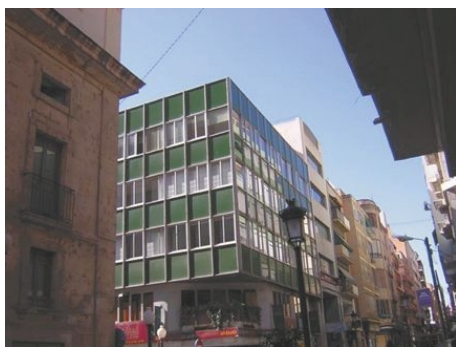
ESTUDIO INTERNACIONAL SAMPERE

→ INTENSIVKURS Lektionen pro Woche: 20 à 45 Minuten Gruppenstärke: 4 bis 6 Personen