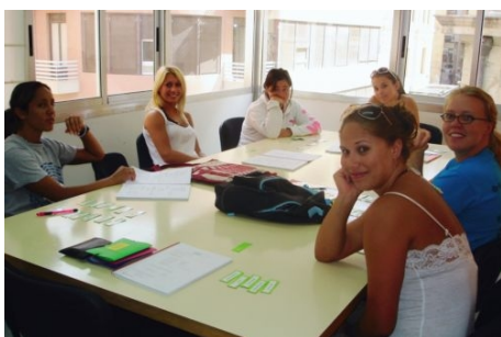
INTENSIVKURS SPANISCH IN ALICANTE

Im Preis enthalten: Einschreibgebühr der Schu-le, Einstufungstest, Unterricht, Lehrmaterial (Bü-cher leihweise), Zertifikat, Betreuung durch die Schule, Reiseinformationen.