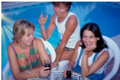
STUDENTINNEN MIT IHRER GASTGEBERIN

MÖBLIERTES ZIMMER Je nach Verfügbarkeit in einer Wohngemeinschaft, in einem Privathaushalt oder als separates Zimmer. Doppelzimmer nur für gemeinsam Reisende. Küchen- und Badbenutzung ist immer möglich. Bettwäsche ist vorhanden, Handtücher bringen Sie bitte mit. Für den Weg zur Schule benötigen Sie 10 bis 30 Minuten zu Fuß oder mit dem Bus. Selbstverpflegung. Die Zimmer können für maximal 4 Wochen im Voraus gebucht werden. Kosten für die Verlängerung pro Woche € 90 für ein Doppelzimmer und € 130 für ein Einzelzimmer.