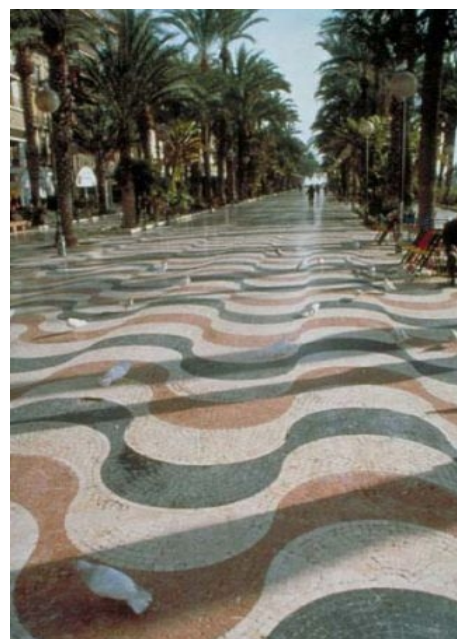
ALICANTES PROMENADE UND FLANIERMEILE

Eine Zehnerkarte für öffentliche Busse kostet ca. € 6.