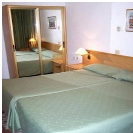
ZIMMER IM HOSTAL RIALTO IN ALICANTE