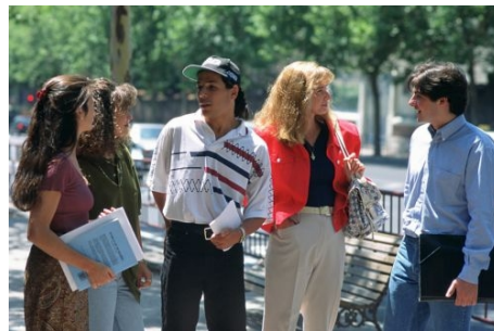
STADTBUMMEL IN ALICANTE

Im Preis enthalten: siehe Einzel-Crash-Kurs