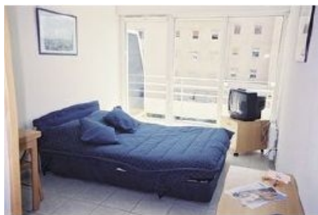
ZIMMER IN DER RESIDENZ MIRABEAU

Die Kurtaxe (taxe de séjour) von ca. € 0,65 pro Person und Tag ist vor Ort zu bezahlen.