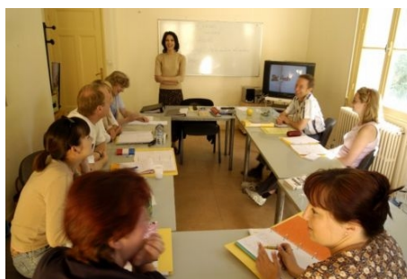
ARBEIT MIT VIDEOPROGRAMMEN

Im Preis enthalten: Einschreibgebühr der Schule, Einstufungstest, Unterricht, Lehrmaterial, Zertifikat, Betreuung durch die Schule, Reiseinformationen.