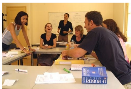
ES WIRD VIEL GELERNT UND VIEL GELACHT!

Mitglied von: FLE, EAQUALS, IALC Lage: nur wenige Schritte vom Cours Mirabeau, vom Marktplatz und Justizpalast entfernt Ausstattung: schön renoviertes herrschaftliches Stadthaus mit 3 Etagen; 15 helle, komfortable und größtenteils klimatisierte Klassenzimmer, Multimediale, Aufenthaltsraum mit Bibliothek Lehrkräfte: Alle Lehrkräfte haben einen Universitätsabschluss und sind für das Unterrichten von Französisch als Fremdsprache qualifiziert. Teilnehmer: Durchschnittsalter während des ganzen Jahres ca. 33 Jahre; durchschnittliche Studentenzahl 60 bis 85, maximal 100. Anteil deutschsprachiger Studenten ca. 14 %. Einstufungstest: schriftlich und mündlich am ersten Unterrichtstag Zertifikat: am letzten Unterrichtstag Internet-Zugang: kostenlos (5 Plätze); Wireless Internetverbindung für Laptops.