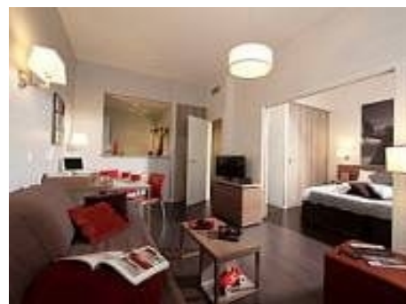
ZIMMER IN DER RESIDENZ ADAGIO

Ein 7-Tage-Pass kostet ca. € 8, ein Monatspass ca. € 25. Wenn Sie abends gerne ausgehen, werden Sie jedoch häufiger mit dem Taxi fahren müssen, da nach 20.00 Uhr keine Stadtbusse mehr fahren.