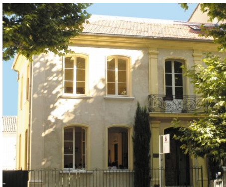
DIE SCHULE IN AIX-EN-PROVENCE

Als Bildungsurlaub anerkannt: Intensivkurs 2 in Hamburg und im Saarland.