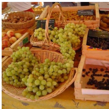
„ROHSTOFF“ FÜR DIE WEINE DER PROVENCE