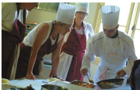
KOCHEN WIE DIE PROFIS

Im Preis enthalten: Einschreibegebühr der Schule, Einstufungstest, Unterricht, Lehrmaterial, Zertifikat, Aktivitätenprogramm, Betreuung durch die Schule, Reiseinformationen.