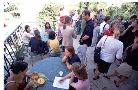
AUF DER TERRASSE DER SCHULE IN AIX

Im Preis enthalten: Einschreibgebühr der Schule, Einstufungstest, Unterricht, Lehrmaterial, Zertifikat, Betreuung durch die Schule, Reiseinformationen.