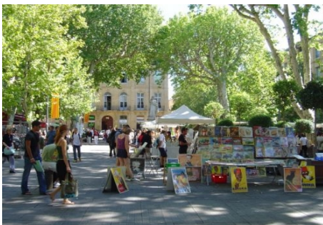
DER MARKT DER KÜNSTLER