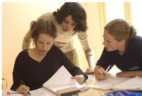
DUOKURS FRANZÖSISCH IN AIX

Im Preis enthalten: siehe Einzel-Crash-Kurs