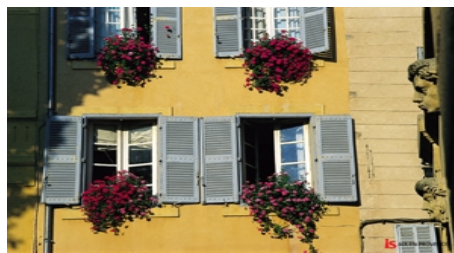
TYPISCHE FASSADE IN AIX-EN-PROVENCE

Im Preis enthalten: Einschreibgebühr der Schule, Einstufungstest, Unterricht, Lehrmaterial, Zertifikat, Betreuung durch die Schule, Reiseinformationen.